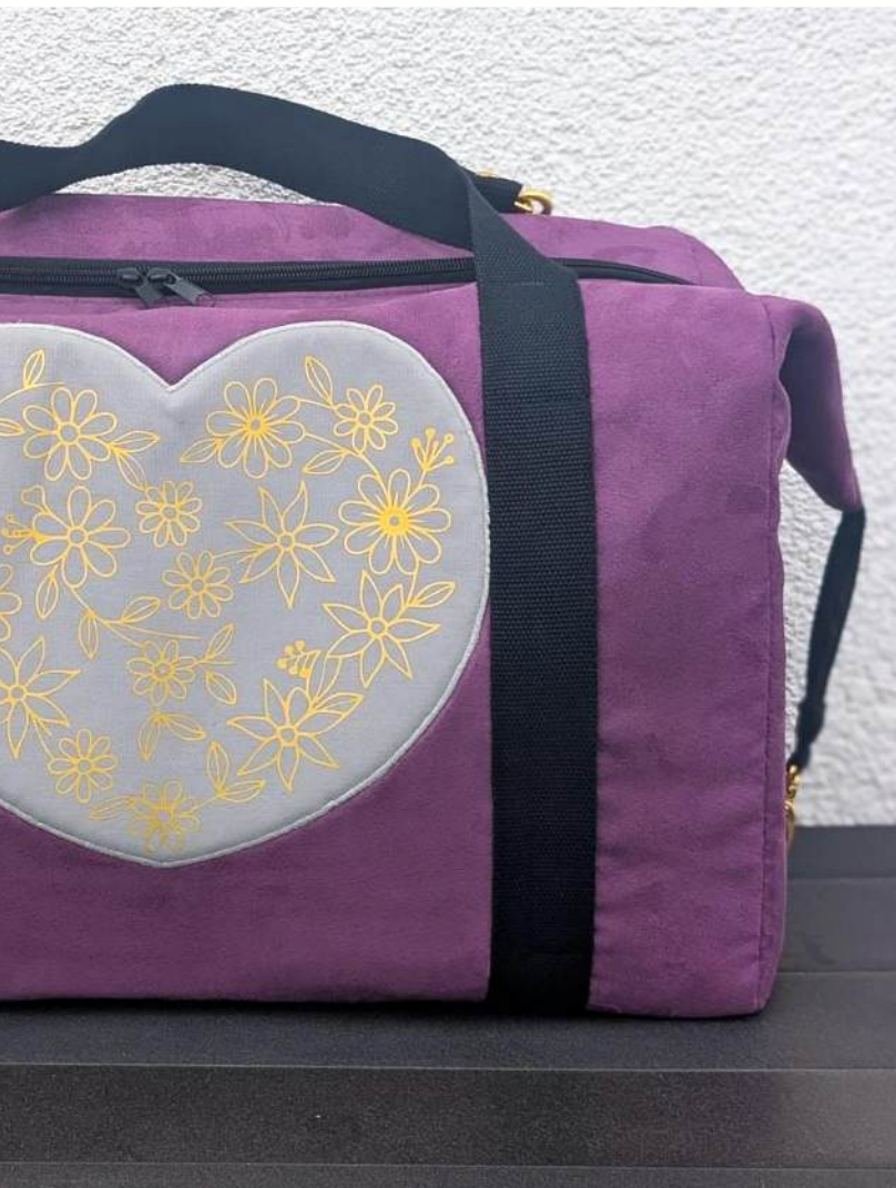
Carolin • www.facebook.com/MonkeysMadebyCaro