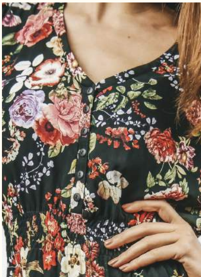
Ausschnittvariante mit Blende

Falls du dir die Blende noch nicht zu traust oder einfach lieber eine schlichere Verarbeitung haben möchtest, kannst du deinen V-Ausschnitt auch einfach mit einem Beleg verstärken.